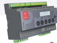
Energiemanager SMARTFOX Pro