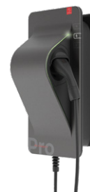
Wallbox SMARTFOX Pro Charger