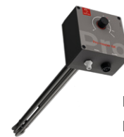
Heizstab SMARTFOX Pro Heater 6K